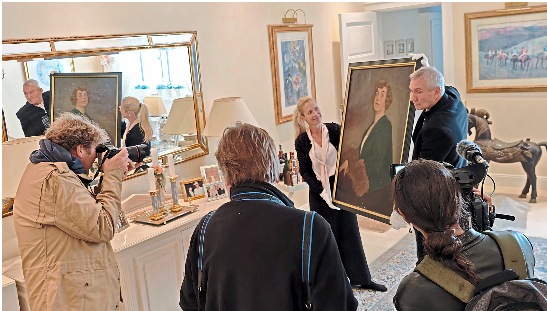
Sie ist es wirklich! Präsentation des Kitty-Bildes im Oktober 2025 in der Berliner Privatwohnung der ehemaligen Besitzerin.

Ist das allein schon Stoff für Legenden, Filme und Bücher – die es alle gibt –, so ist noch ein besonderer Krimi rund um das Porträt der Bordellbetreiberin entstanden. Vor gut 25 Jahren